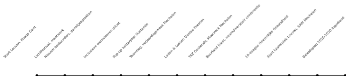
BlinkOut Tijdslijn 2024 - Twaalf maanden bouwen aan verbinding

Het najaar bracht ons naar Diest, Gent en Leuven voor conferenties en de 10-daagse van de Geestelijke Gezondheid. We sloten het jaar af met een beleidsmijlpaal: de indiening van ons Beleidsplan 2026-2030.